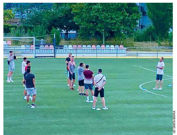
La UD Santa María va tancar la temporada amb una trobada el 29 de juny, a l'estadi de la Ferreria