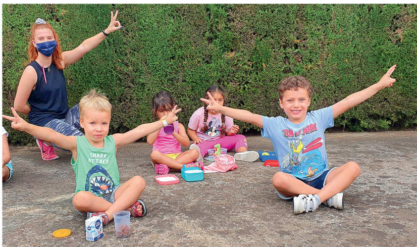
Els grups del Casal Esportiu són estables, amb un mateix monitor, i disposen d'un vestuari i d'un bany d'ús exclusiu