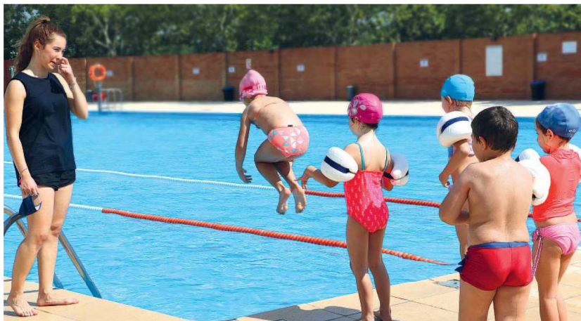
La piscina és una de les activitats favorites dels infants que participen al Casal Esportiu, que es farà durant tot el mes juliol, a la Zona Esportiva Centre