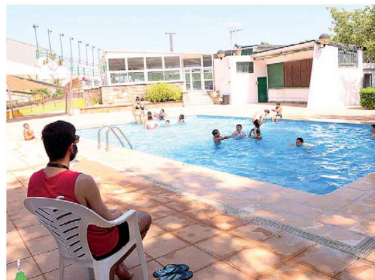
La piscina petita de la Zona Centre ja està en funcionament després de les obres de millora