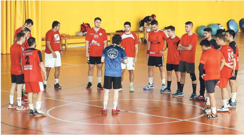
El primer equip del CH La Salle Montcada va començar a entrenar l'1 de juliol, després de tres mesos d'aturada per la pandèmia de la Covid-19

El primer equip debutarà el 4 d'octubre, a la pista del Sant Esteve Sesrovires