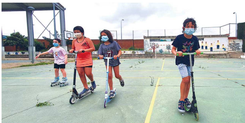
Les mesures de seguretat i prevenció de la Covid-19 estan ben presents a totes les activitats organitzades en el marc del Casal Esportiu