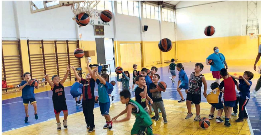
Una part de l'èxit de l'escoleta és fruit de l'acord amb l'escola La Salle per oferir el bàsquet en el marc de les activitats extraescolars

L'entitat té aquesta temporada prop de 220 jugadors i un total de 15 equips