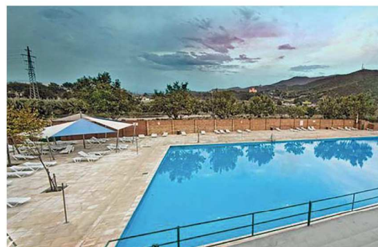
La temporada de la piscina del carrer Bonavista s'allargarà fins al 13 de setembre

Medures d'higiene. Les restriccions sanitàries pel coronavirus no permetran utilitzar les dutxes dels vestidors, tot i que estaran dispo-