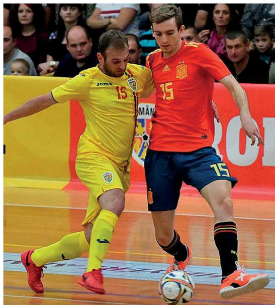
Sergio González va debutar amb selecció espanyola absoluta el 2 de novembre del 2018