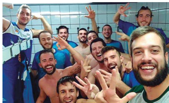
Els jugadors del sènior A de la UB MiR van celebrar al vestidor la seva tercera victòria seguida

Sènior femení. Ha perdut els tres partits que ha disputat al grup 6è de Tercera contra el CB Matadepera (66-42), el BC Sant Quirze (30-64) i el CB Torelló (46-52) | RJ