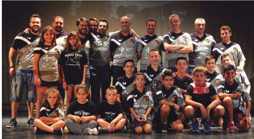
El Club Tennis Taula La Unió ha canviat els colors de la seva samarreta i ha ampliat la quantitat de jugadors amb noves incorporacions a la seva escola