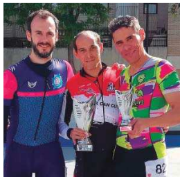
ROLLER CAN CUIAS