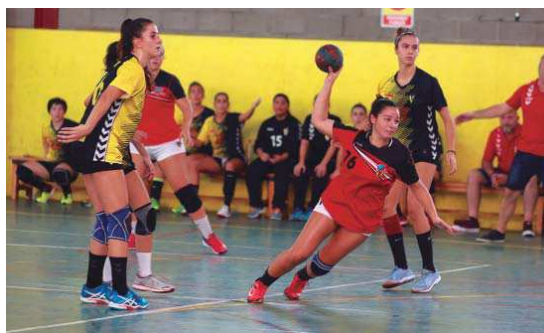
El juvenil femení del CH La Salle ha guanyat tots els partits que ha disputat fins ara a Lliga Catalana

El juvenil femení A del CH La Salle ha començat amb molt bon peu la seva participació al grup A de la primera fase de Lliga Catalana. Després de la disputa de tres jornades, l'equip d'Àlex Expósito ocupa la primera posició en solitari gràcies a les tres victòries que ha aconseguit com a local –contra l'Esportiu Castelldefels (41-24) i l'EH Sant Vicenç (32-31)– i a la pista de l'Handbol Sant Quirze (26-28) | RJ