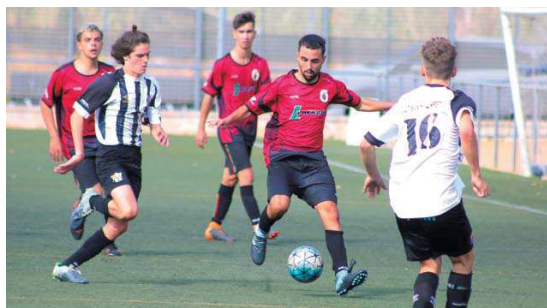
El juvenil A va jugar el 7 d'octubre el seu primer partit com a local contra el Santa Perpètua (4-1)