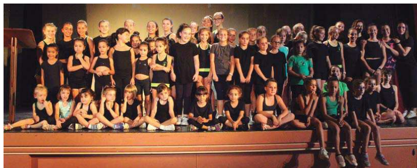
El Club Gimnàstic La Unió, que va celebrar el seu 25è aniversari el 2015, està format per un total de 95 gimnastes, amb edats dels 3 als 17 anys