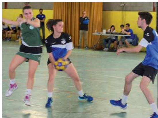
El CK Montcada B pot proclamar-se campió de lliga a 2a Divisió després d'eliminar el KC Barcelona B

El segon equip del CK Montcada disputarà la final de Segona Divisió després d'eliminar el KC Barcelona B, que va ser el campió de la lliga regular, amb un 2-0 a les semifinals. El rival a la final, que es jugarà l'11 de juny a Terrassa, serà el CK Castellbisbal, que ha eliminat l'SLKC | RJ