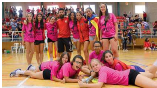
Les jugadores i el tècnic de l'infantil van poder celebrar el seu èxit al pavelló Miquel Poblet

L'infantil femení del CH La Salle s'ha classificat per disputar la fase final del Campionat d'Espanya de la categoria després de guanyar el sector D que es va disputar entre el 26 i el 29 de maig a Saragossa. Les lassal·lianes, que van derrotar a la fase prèvia el Puerto de Sol de Màlaga (24-17) i el Balonmano La Jota (20-24), van aconseguir la victòria a la final contra l'SD Lagunak per un ajustat 23 a 22. La fase final del Campionat d'Espanya es disputarà entre el 8 i el 12 de juny i les montcadenques jugaran a Oviedo, al grup 2, contra