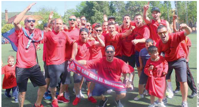
La festa de la Unió es va traslladar fins a Can Sant Joan on els jugadors van participar en una rua i alguns es van donar un bany al Rec Comtal