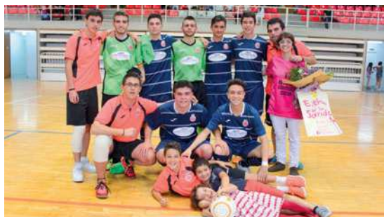
Després d'una gran temporada, el juvenil B jugarà la propera temporada a la Primera Catalana