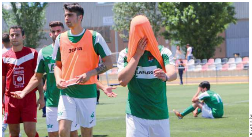
Al final del partit contra el Canyelles, els jugadors del CD Montcada no podien amagar la seva decepció després del segon descens consecutiu

Obra nueva Rehabilitación de edificios Reforma de viviendas Fachadas, cubiertas y tejados Reformas de inmuebles Eficiencia y ahorro energético Mantenimiento de comunidades Mantenimiento de industria