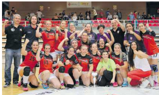
El cos tècnic i les jugadores del CH La Salle van celebrar el títol de campiones a la pista del pavelló