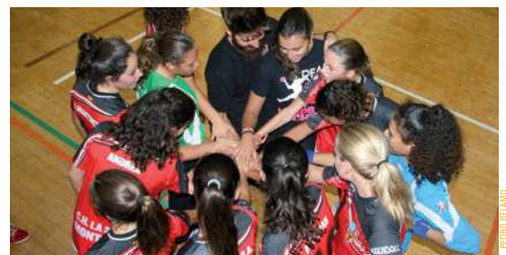
L'infantil femení A, fent pinya, abans d'uns dels seus partits d'aquesta temporada tan exitosa

Copa Catalana. L'infantil femení també juga el dia 21, a les 18.30h, les semifinals de la Copa Catalana al pavelló Miquel Poblet contra el BM Granollers | RJ