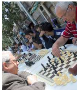
Torneig d'Escacs al carrer Major