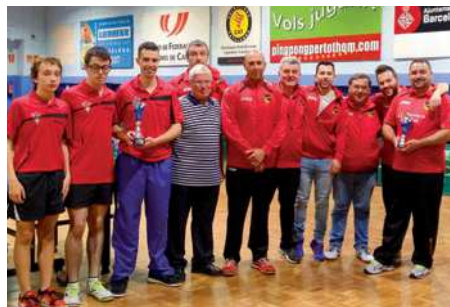
TT LA UNIO