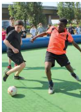
3x3 de futbol sala a l'Espai Poblet