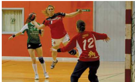
El sènior femení del CH La Salle va poder certificar la seva classificació a la pista de Les Franqueses

El sènior femení del CH La Salle disputarà a casa el Top-4 de Primera Catalana ja que el pavelló Miquel Pobleat acollirà el 28 i el 29 de maig la fase final per determinar el campió i els tres equips que puguen a Lliga Catalana. Les lassal·lianes han acabat la segona fase a la segona posició del grup A amb 7 punts i un balanç de tres victòries, un empat i dues derrotes. L'equip de Pau Lleixà va certificar de forma matemàtica la seva classificació per al Top-4 amb el triomf que va aconseguir el 7 de maig a la pista de l'AEH Les Franqueses (24-27). A l'última jornada, les montcadenques van empatar a casa contra l'H.