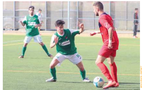
L'UE Sant Joan-Atlètic i el CD Montcada lluiten per objectius diferents en aquest tram final