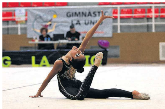
La competició va aplegar el 16 de febrer unes 150 gimnastes d'arreu de Catalunya

L'entitat va organitzar amb èxit el II Trofeu de Sant Valentí