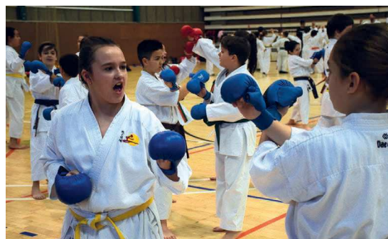
La trobada de karate va reunir infants de les escoles del municipi que practiquen aquest esport

Karate. El Consell de l'Esport del Vallès Occidental Sud (CEVOS) va organitzar el 22 de febrer al pavelló Miquel Poblet una trobada de karate, que va omplir l'equipament del Pla d'en Coll d'esportistes i familiars durant tot el matí | SA