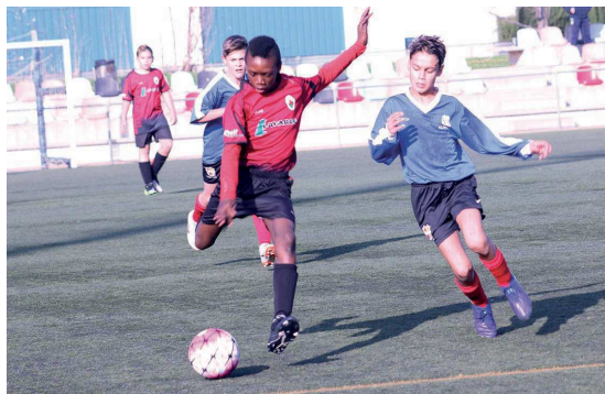
L'aleví A del FB Montcada ocupa la tercera posició, amb 37 punts, a només tres del primer lloc