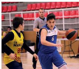
L'equip va superar el Santa Coloma per 68-60

això, al darrer partit de lliga, els de la UB MiR es van retrobar amb la victòria contra el quart, el CB Santa Coloma, per 68-60. La propera jornada visitaran la pista del Mataró Parc Boet 1 i la següent, en ser una lliga de set equips, descansaran i podrien perdre el liderat si venç el segon classificat | AC