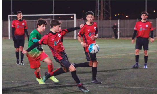
El juvenil B del FB Montcada ha sumat 23 punts en tretze jornades, amb 8 victòries i 4 derrotes

El segon equip juvenil del FB Montcada, al grup 30è de Segona Divisió, lluita per consolidar-se a la part alta de la classificació en un lliga que, tret del primer lloc que ocupa l'Escola de Futbol de Sabadell amb 39 punts, està molt disputada. Els montcadencs són quarts amb 24 punts en 13 jornades –vuit victòries i quatre derrotes– i se situen a tres punts del segon classificat, l'Escola de FB Ripollet A, i a només dos del tercer, el CF Ripollet B. Per darrere, el segueixen el FC Sant Quirze B amb 23 punts –i un partit menys– i el CF Sabadell Nord B i l'UD Tibidabo Torre Romeu A –aquest amb un partit més– que sumen 22 punts i són 6è i 7è, respectivament. A les últimes cinc jornades, els juvenils s'han