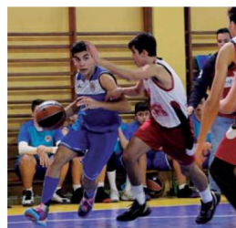
El cadet A de la UB MiR lidera la segona fase

un resultat de 66-49. Amb una mitja de 72 punts a favor i 43 en contra, és també el millor equip en aquests dos aspectes. La propera jornada, els montcadencs rebran la visita del cuer, el CB Tona, que només ha jugat un partit –ja que es tracta d'una lliga de set equips– que va acabar amb derrota per 52-58 contra el CE Laietà Blau | AC