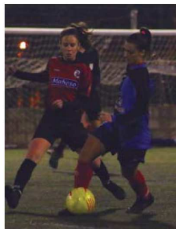
El FB Montcada rebrà el FC Girona el dia 2

Proper enfrontament. El FB Montcada té un partit complicat el pròxim 2 de febrer, ja que rebrà la visita del primer equip del FC Girona, que està classificat a la segona posició amb 32 punts. Les gironines es van retrobar amb la victòria a l'última jornada disputada en superar l'UE Tona per 3-1, després de quatre partits sense guanyar | SA