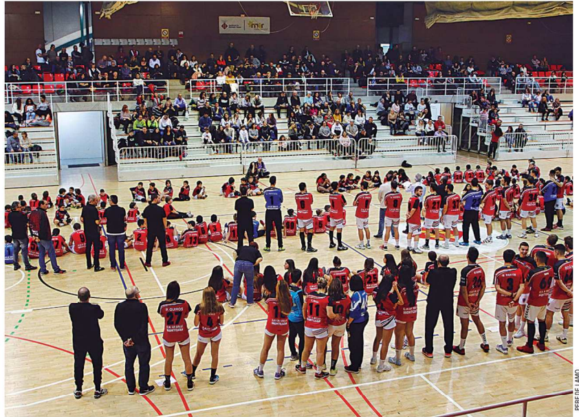
La vintena d'equips del CH La Salle va omplir la pista del pavelló Miquel Poblet el dia de la presentació davant de la afició montcadaenca

Equipaments. Serratos, per la seva banda, va anunciar que abans d'estiu està previst que finalitzin les obres de construcció de la pista descoberta que hi ha al costat del pavelló Miquel Poblet. “Servirà per a entrenaments i, fins i tot, per a partits, sempre que la climatologia ho permeti”, va dir l'edil, tot afegint que enguany es faran importants inversions en equipaments esportius: “Es canviarà la gespa dels dos camps de futbol i també es faran millores a la pista del carrer Bonavista per acabar amb les filtracions laterals, canviar el marcador i arrenjar la sala de reunions”.