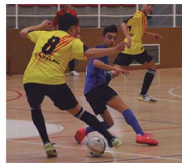
El cadet B jugarà el pròxim matx contra el Rubí

Després de 13 partits, els montcadencs ocupen el 6è lloc amb 22 punts –set victòries, un empat i quatre derrotes– i té cinc punts d'avantatge sobre el seu competidor més proper, el CE Escola Pia Sabadell. Curiosament, l'únic empat del cadet va ser contra el CE Rubí (3-3), equip al qual s'enfrontarà al proper partit | AC