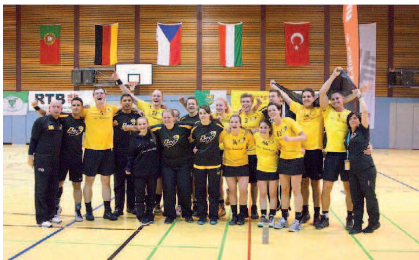
La montcadencina, amb el número 46 a la samarreta, celebra amb els seus companys una de les cinc victòries aconseguides a Bergish-Gladbach

La montcadencina és la primera catalana que juga a la lliga de korbball d'Anglaterra, país on aquest esport també és minoritari: "Holanda i Bèlgica són els