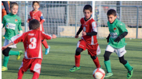
El segon derbi entre els prebenjamins A va ser més igualat que el disputat a la primera volta

El prebenjamí A del CD Montcada, que a la primera jornada de lliga va perdre el derbi contra l'EF Montcada (6-0), va celebrar com si fos una victòria l'empat sense gols que es va produir en l'enfrontament de la segona volta que es va disputar el 7 de febrer a l'estadi de la Ferreria. El conjunt de l'Escola és tercer al grup 34è de la lliga prebenjamí amb 38 punts, mentre que els verds són quarts per la cua, amb 9 | RJ