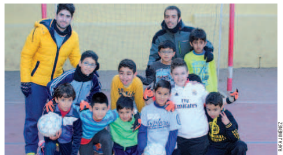
Grup de nens que fan la primera de les sessions de futbol a l'escola El Turó, al carrer Montu