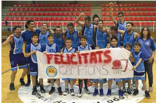
Els jugadors del GrupoUno CTC de l'UB MIR van celebrar el seu èxit a la pista després del partit