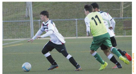
L'UD Santa Maria ha guanyat els seus últims nou partits i ho té tot de cara per jugar la promoció

perden des del mes de desembre, són tercers amb 53 punts, un menys que el Can Mas que ha jugat un partit més. L'equip d'Alfonso Torres ho té complicat per arribar al primer lloc, però jugarà la promoció si guanya els quatre partits que queden | RJ