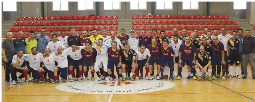
Els exjugadors de CFS Montcada, FC Barcelona i Catgas Santa Coloma van recordar els vells temps i es van fer una fotografia de família al mig de la pista

El triangular amistós va recollir uns 400 quilograms d'aliments per a la Creu Roja