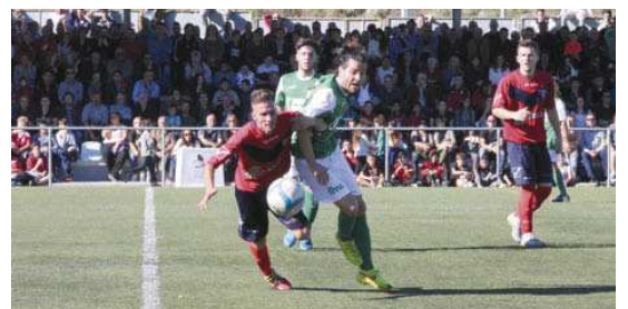
El partit va ser intens, però amb molta esportivitat, tant a la gespa com entre els aficionats