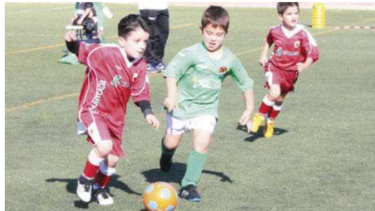
El derbi de debutants que es va disputar el 14 de novembre va finalitzar amb victòria vermella (18-0)