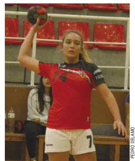
Imatge de l'infantil femení B, al Miquel Pobleat