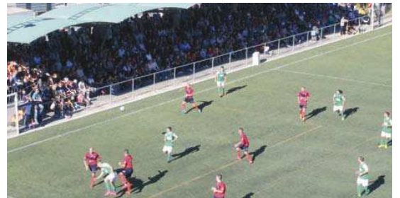
Imatge aèria del derbi que es va disputar el 15 de novembre amb les grades totalment plenes