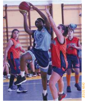
Entrada a cistella contra el CE Sant Gervasi