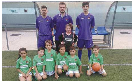
El prebenjami D del CD Montcada, en una foto de pretemporada, va guanyar el derbi local