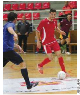
El sènior A, en l'últim partit a casa

El Broncesval Montcada és últim al grup 3r de Segona B i acumula deu jornades sense guanyar. L'equip de Javi Ruiz ha perdut els seus quatre darrers partits com a local -l'últim va ser a la 10a jornada contra l'Ol. Floresta (4-5) per culpa d'un gol del porter visitant a dos minuts del final- i ha encadenat cinc empats seguits com a visitant. A la darrera jornada, el Broncesval va empatar sense gols a la pista de l'Esparreguera (0-0), en un resultat poc habitual en el món del futbol sala. L'FS Montcada suma 8 punts en 11 jornades i és últim, empatat amb l'Ol. Floresta | JA