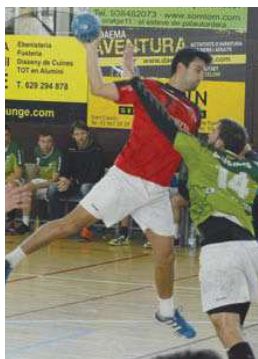
El CH La Salle, a la pista de l'H. Palautordera

A l'últim partit, el sènior A, que no guanya des del 10 d'octubre, va arribar al descans amb un desavantatge mínim d'un gol (12-11) i, després d'una gran remuntada, va deixar escapar un punt. "A falta de cinc minuts, guanyàvem de quatre gols i la pressió del rival i un parell d'errors ens van deixar amb aquest resultat final", ha lamentat Jaume Puig | JA