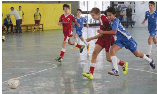
La primera victòria de l'infantil de l'EF Montcada va arribar el 8 de novembre contra el CN Caldes D

L'equip vermell va vèncer per 5 a 1 contra un rival que encara no ha pogut puntuar