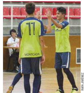
Els jugadors del juvenil A, celebrant un gol

El juvenil A del CFS Montcada va aconseguir una gran fita el 7 de novembre amb una victòria de mèrit al pavelló Miquel Pobleat contra el FC Barcelona (6-3), un rival gairebé intractable a Lliga Nacional i que no perdia una partit oficial des de feia tres anys. L'equip d'Álex Fernández és setè amb 16 punts i un balanç de cinc victòries, un empat i quatre derrotes | RJ