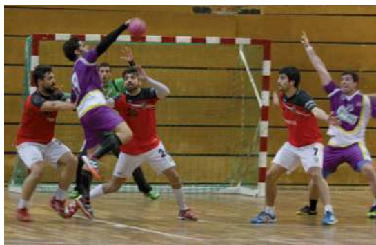
El CH La Salle no va poder tornar de la pista del líder, el Sant Martí Adrianenc, amb cap punt