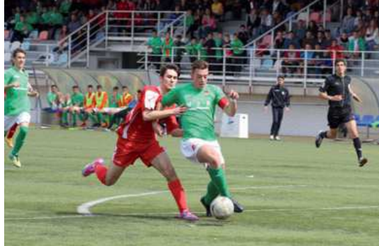
L'estadi de la Ferreria gairebé es va omplir per veure un intens i entretingut derbi juvenil