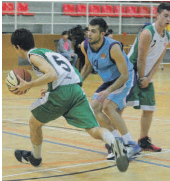
Gran temporada del sots-21 C de l'UB MIR que lluita per aconseguir el campionat de lliga

Tot i el seu bon rendiment, el sots-21 C montcadenc té un liderat provisional ja que el segon classificat, l'UE Ripoll, suma tres punts menys i té dos partits pendents per disputar.