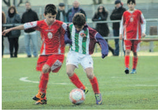
L'aleví B s'ha consolidat a la part alta de la classificació al grup 13è de la Segona Divisió

L'aleví B de l'EF Montcada ocupa, amb 25 punts, la quarta posició al grup 13è de la Segona Divisió a manca d'una jornada per al final de la primera volta. Els vermells, que van iniciar la temporada amb cinc victòries consecutives, van patir en el seu últim partit contra el segon classificat, l'UE Castellar (5-2), la seva quarta derrota. Els montcadencs tancaran la primera volta amb un interessant partit a casa contra el tercer, el Can Rull Rómulo-Tronchoni, que té tres punts més.