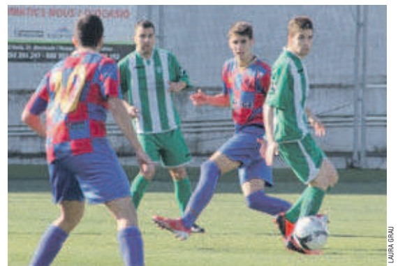
L'UE Sant Joan ha trobat la regularitat de resultats i veu amb més optimisme la permanència

Suma quatre punts en dos partits a casa i en fa vuit que no perd