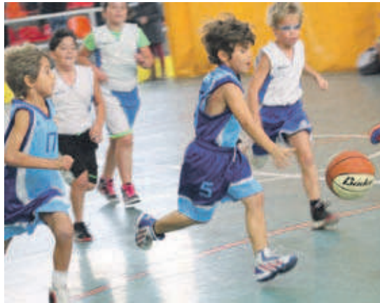
El premini B de l'UB MIR ha iniciat la segona part de la competició al nivell D-1