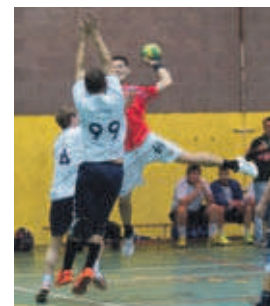
El sènior B no acaba de trobar la regularitat