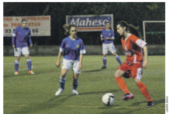
L'EF Montcada va obtenir un prestigiós triomf a casa contra el líder, el Sant Gabriel (2-1)