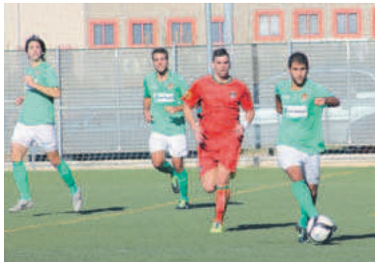
El CD Montcada ha de reaccionar si no es vol trobar amb problemes per mantenir la categoria

“Tenim un pressupost molt limitat i aquest equip està fet per aconseguir la permanència, però l'últim partit a Llo-