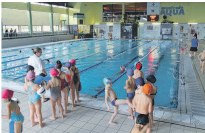
Montcada Aqua segueix amb el seu dia a dia i els cursos de natació per a petits són algunes de les activitats amb millor acollida entre la ciutadania