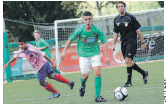
El cadet està protagonitzant una bonica lluita amb altres tres equips per ser segon del seu grup

(3-1) i el Ripollet A (3-2). El cadet està a cinc punts del primer, tot i que no serà fàcil atrapar el Can Rull Rómulo Tronchoni que no ha perdut cap partit i que fa tres jornades va provocar la primera derrota dels montcadencs amb un contundent 9 a 1.