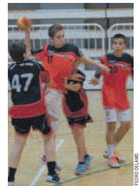
L'infantil masculí, sense gaire sort

L'infantil masculí del Club Handbol La Salle no està tenint gaire sort aquesta temporada al grup D de la Primera Catalana. De moment, els lassal·lians, entrenats per Víctor Corral, només han aconseguit una victòria –va ser contra l'últim, el Sant Quirze, a la 6a jornada. Als seus dos últims partits, ja de la segona volta, els montcadencs, penúltims a la classificació després de 12 jornades, van perdre contra l'H. Terrassa (32-16) i l'H. Sant Cugat C (10-20) | RJ