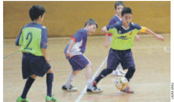
El benjamí A no troba cap equip que li faci ombra i, de moment, ha guanyat tots els seus partits

(100 gols) i el menys golejat (20). A les dues últimes jornades de la primera volta, va sumar dos triomfs més contra l'FS Olesa C (2-14) i el Rubí (5-2). El benjamí A acumula 33 punts, set més que el segon, l'FS Ripollet.