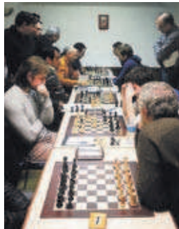
Primera jornada a Lleida de l'UE Montcada A

D'altra banda, el primer equip va finalitzar a la desena posició a la Copa Territorial de Barcelona, que es va disputar el 19 de gener a les Cotxeres de Sants. El club també confirma que l'Open d'Escacs, que es farà del 25 de juny al 3 de juliol, tornarà al Kursaal | RJ