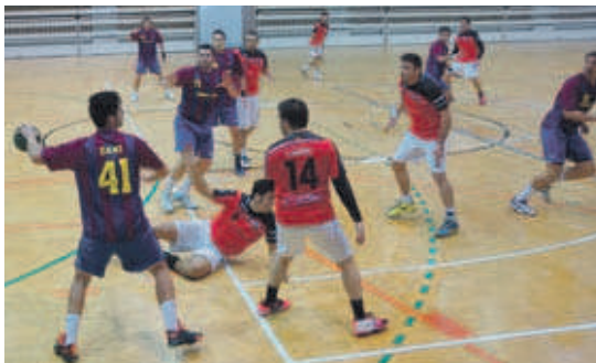
El sènior masculí del CH La Salle va sumar dos punts importants a casa contra el Gavà

Femení. És líder solitari a Primera després de guanyar l'OAR Gràcia (17-22) i la Llagosta (34-6).