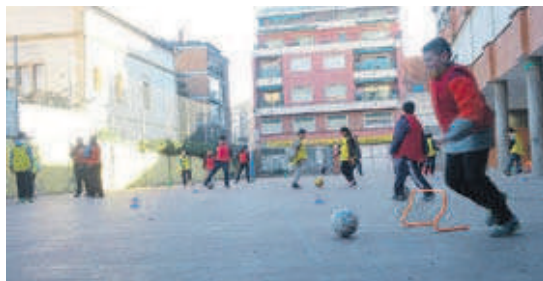
El futbol, sempre tan popular entre els més petits, ha passat de formar tres equips a tenir només un

El programa d'activitats extraescolars del col·legi El Turó ha vist reduïda la participació d'alumnes a causa de la necessitat d'augmentar les quotes i aquest curs fan esport al col·legi després de l'horari lectiu la meitat de nois i noies que ho feien l'any passat. Per manca de participants s'han deixat de fer el multiesport i el bàsquet i s'han perdut dos dels tres equips de futbol. En total, s'ofereixen cinc activitats esportives. A més del futbol, amb 12 alumnes, hi ha karate (7), funky