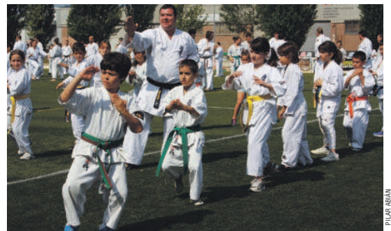
Per un dia, els karatekes van canviar el tatami per la gespa per practicar el seu esport

(150 cren del club local i la resta provenien d'escoles de Barcelona, Ripoll, Barberà i Sabadell). L'acte va tenir un caire solidari i es van recollir 600 quilograms d'aliments per a la Creu Roja.