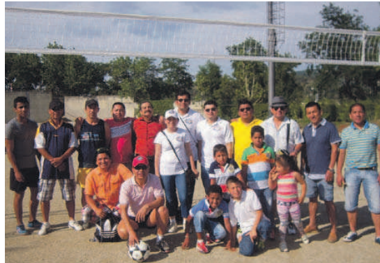
Integrants de la nova entitat esportiva que s'ha creat a Montcada i Reixac

Un grup de ciutadans equatorians, amb residència a diferents barris de Montcada i Reixac, ha creat una nova entitat esportiva al nostre municipi. Es tracta del Club Esportiu d'Ecuavoley Montcada i Reixac. L'ecuavoley és un esport que va néixer fa més de 80 anys a l'Equador i que s'inspira en el voleibol, tot i que té diferències: es disputa entre equips de tres jugadors, l'alçada de la xarxa és més alta i la pilota que s'utilitza, una de futbol, és més pesada. Des de fa uns tres anys, una trentena de ciutadans es reuneix els dissabtes a la tarda a la Ribera –des de fa un any, ho fan al Parc de les Aigües– per jugar partits d'ecuavoley, un esport que no està reconegut oficialment. “Sempre hem tingut molt bona acceptació per part de la gent del barri. Només som un grup de gent que ens agrada