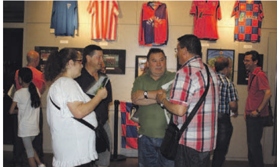
A l'exposició sobre l'UE Sant Joan Atlètic es poden reviu els 25 anys d'història del club

L'UE Sant Joan Atlètic va posar el punt i final a la celebració del seu 25è aniversari amb un emotiu acte celebrat el 21 de juny a l'Espai Cultural Kursaal durant el qual es va inaugurar una exposició sobre la història de l'entitat i es va projectar el documental 'Can Sant Joan, cuando el balón empezó a rodar', dirigit per Miguel Ángel López. Va ser un moment especial en què es van reviu molts records a través de la més de cinquanta de fotografies antigues que es recullen a la mostra, on també es poden veure algunes pilotes i samarretes velles. L'acte d'inauguració de l'exposició, que es podrà veure fins al