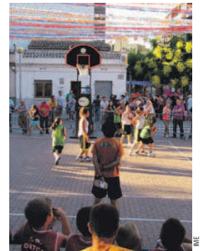
El bàsquet es va apoderar del carrer

64 infants, distribuïts en 16 equips, van participar el 22 de juny al torneig de 3x3 de bàsquet que es va fer a la plaça del Bosc de Can Sant Joan. Aquesta competició, organitzada pel CEB Can Sant Joan i l'IME, va obrir el calendari d'activitats esportives d'aquest estiu. El 14 de juliol, es farà a Montcada Aqua el 'Mulla't per l'esclerosi' i el 17, a la piscina exterior de la Zona Esportiva Centre, es disputarà el Trofeu Vila de Montcada de natació.