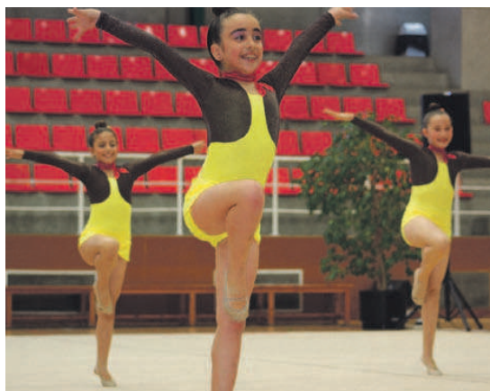
Un dels moments de l'exhibició de gimnàstica que es va fer al pavelló Miquel Poblet

El Club Gimnàstica La Unió va celebrar el dia 22 de juny al pavelló Miquel Poblet el seu festival de fi de curs amb la participació de 97 nenes, que formen part dels grups base, competició, iniciació i promoció. Els responsables del club valoren positivament les actuacions que es van poder veure i la presència de públic a les grades | RJ