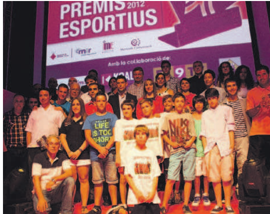
Tots els premiats, durant la gala que es va celebrar el 6 de juliol de 2012 a Montcada Aqua

Nominats. En l'apartat de millor entitat, hi ha sis finalistes: la Unió Escacs Montcada, el Club Ball Esportiu Eva Nieto, el Club Petanca Can Sant Joan, el Futbol Sala Montcada, el Lee Young i el Shi-Kan. Pel que fa al millor entrenador, opten al premi Norbert