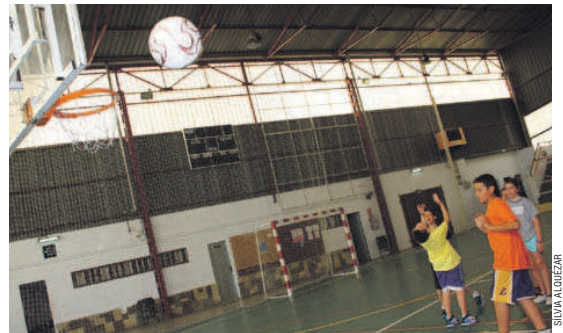
La pista coberta de la Zona Esportiva Centre és un dels espais on es desenvolupa el casal

S'allarga fins a la cinquena setmana i es recupera el campus de futbol