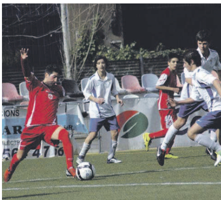
El cadet A va caure de forma contundent contra el Granollers a la 16a jornada

Júnior A. Continua a la cinquena posició del grup 7 de Primera, tot i que ha patit dues derrotes seguides contra la Penya Barcelonista Sant Celoni (4-3) i el Cardedeu (1-2) | RJ