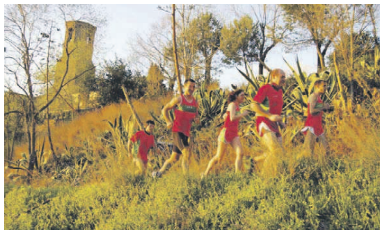
La JAM té un grup d'atletisme de muntanya que s'entrena habitualment per la Serralada de Marina

La Joventut Atlètica Montcada (JAM) prepara l'organització, amb la col·laboració de les regidores d'Esports i Medi Ambient, de la primera edició de la Montescatano, una cursa de muntanya que es farà el 28 d'abril per la Serralada de Marina amb sortida i arribada a la plaça de l'Església. El recorregut serà de 15,4 quilòmetres amb un desnivell acumulat de 684 metres. Les inscripcions, a un preu de 15 euros, es podran fer entre el 4 i el 18 d'abril a la pàgina web de l'entitat ( www.jam.cat ). En aquesta primera edició, el número de participants es limitarà als 400, "ja que les curses de muntanya són molt exigents i els espais són més