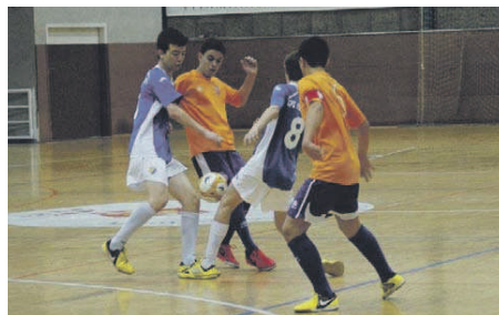
L'equip cadet B del Broncesval camina amb pas ferm cap a l'ascens

Només ha cedit un empat i una derrota a Segona