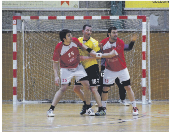
La defensa i els problemes a la porteria estan marcant la recta final de la temporada