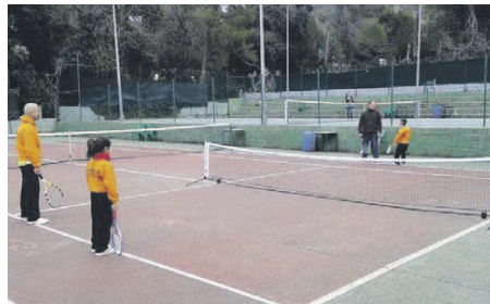
Un partit de dobles format per parelles amb pares i fills

Aquest torneig tan peculiar es fa fins el 27 d'abril