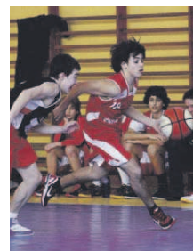
El cadet B, en acció

partit contra l'UE Sant Fost (82-86). El 27 d'abril, el cadet B rebrà la visita de Les Franqueses en un partit que li podria donar el lideratge si tots dos equips continuen amb aquesta dinàmica.