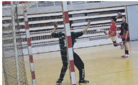
L'infantil A jugarà el TOP-4 de Lliga Catalana que porta als Campionats d'Espanya

Primer equip del club que jugarà els campionats d'Espanya