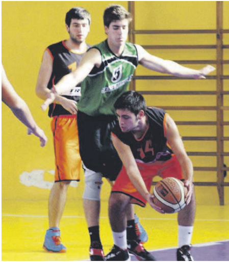
El sots-21 manté una molt bona segona posició a la taula