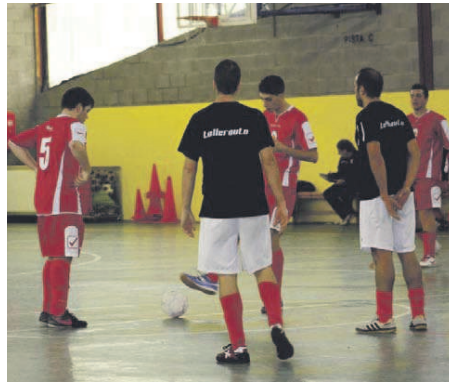
El sènior de l'EF Montcada encara té dos partits pendents per disputar