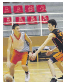
Dues victòries seguides del júnior B

Júnior A. Després de perdre el derbi, s'ha recuperat amb dos triomfs davant