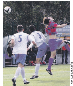
L'UE Sant Joan no troba la regularitat