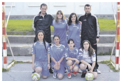
L'AE INS Montserrat Miró ha pogut reunir un equip de futbol sala femení