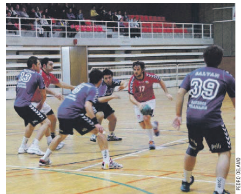
El Vilamajor va tenir més intensitat perquè es jugava entrar a les fases d'ascens

tercers gràcies a la victòria sobre el cuer, el CE Montigalà-Badalona B (8-2). Amb un partit més que el quart i tres punts d'avantatge respecte el cinquè. L'AFS Bosc d'en Vilaró manté totes les opcions en una recta final de lliga apassionant | RJ