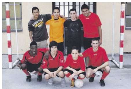
Aquest curs, l'INS La Ribera només ha pogut fer un equip amb 10 jugadors juvenils