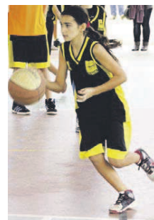
L'infantil femení, en ratxa

Després d'un inici amb dubtes al nivell D, l'infantil femení del CEB Can Sant Joan ha agafat una dinàmica positiva i ha sumat les seves tres primeres victòries de forma consecutiva. Les dues últimes, contra l'Arenys Bàsquet B (25-20) i el Bàsquet Ribes (45-40). L'infantil va acabar a l'última posició a la primera fase, al nivell C | RJ