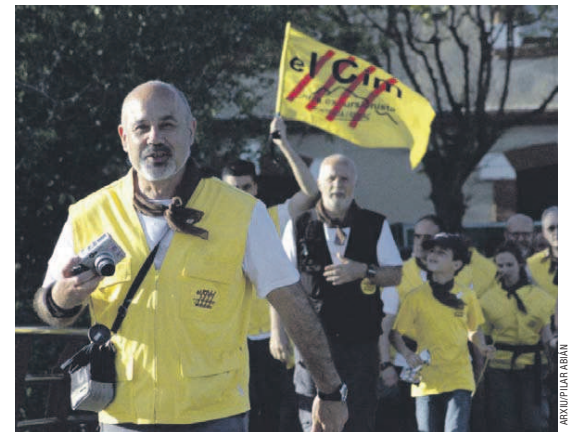
L'última edició de la Marxa a Peu a Montserrat va comptar amb la participació de 390 persones

Altres activitats. Abans de la Setmana Santa, que alguns membres de l'entitat aprofitaran per anar a esquiar a l'estació Les Arcs del Alps francesos, El Cim organitza el 23 de març la 20a etapa del GR-92 que uneix Molins de Rei i Bruguers i que serveix per celebrar el 25è aniversari de l'entitat. Després de les vacances, es començaran a organitzar les primeres excursions preparatòries de la Marxa a Peu a Montserrat. La primera es farà el 7 d'abril amb una caminada a Can Coll. La segona està prevista per al dia 14 amb una sortida per la Serra de Collserola. Cap de les dies excursions no necessita inscripció prèvia.