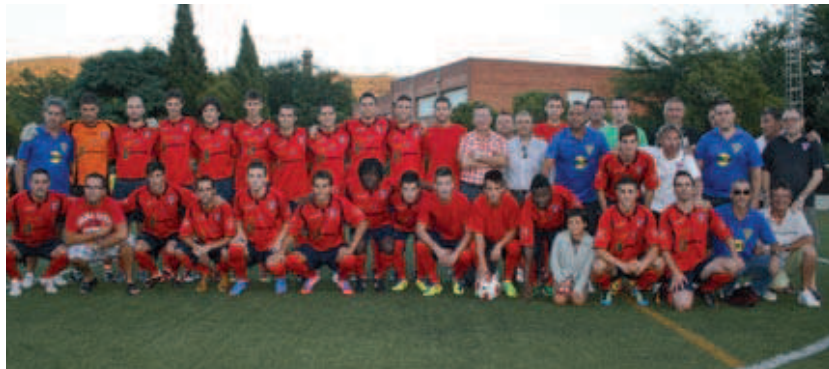
La UE Sant Joan Atl. es va presentar davant la seva afició l'1 de setembre a l'estadi del barri abans de disputar el seu propi torneig