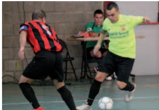
Una imatge d'un partit de l'FS Montcada B durant la passada temporada