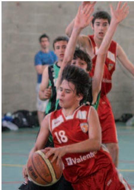
Imatge de la temporada passada de l'infantil del CB Montcada