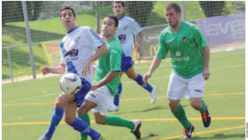
Una acció del primer partit oficial del CD Montcada a l'estadi de la Ferreria que va finalitzar amb una derrota per la mínima (2-3)