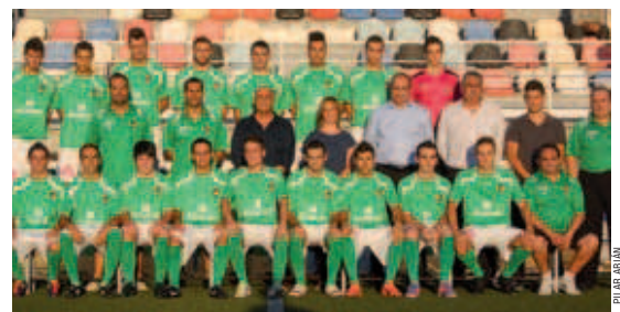
El Montcada B, durant la seva presentació de l'1 de setembre a l'estadi de la Ferreria