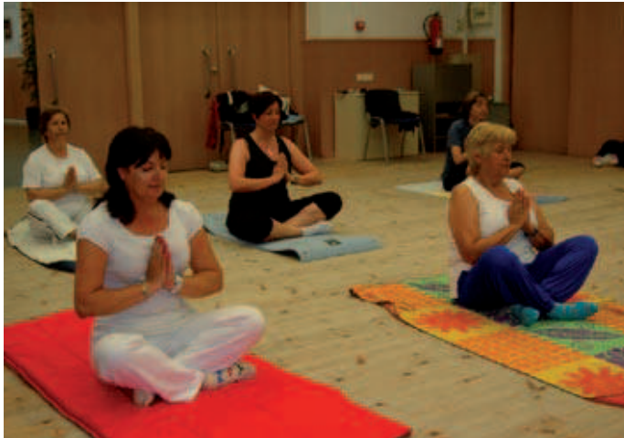
Les activitats d'ioga es fan a una de les sales del pavelló Miquel Poblet tots els dimarts i dijous per la tarda

El gruix dels cursos començarà el 17 de setembre i s'allargarà fins al juny i juliol de 2013. Els preus oscil·len entre els 45 i els 95 euros trimestrals, amb descomptes especials per a residents al municipi que siguin majors de 65 anys, facin el pagament anual o formin part