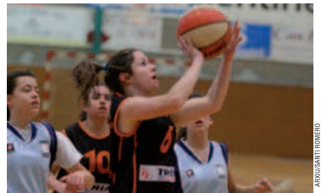
El júnior femení continua a l'estructura esportiva de l'Elvira-La Salle