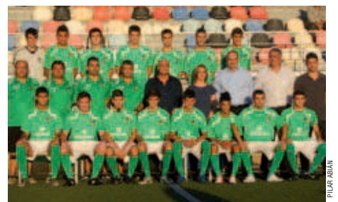
Un renovat juvenil s'ha marcat el repte de tornar a pujar a Preferent

En el retorn a Primera, el juvenil verd jugarà al grup 7 i coincidirà amb el juvenil de l'EF Montcada. Per veure el primer derbi no s'hauran d'esperar molts partits ja que aquest arribarà a la primera jornada de la lliga. Serà el dissabte 6 d'octubre, a les 16h, a l'estadi de la Ferreria.