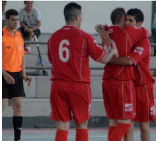
Els jugadors de l'AE Can Cuiàs, en l'últim partit de la temporada passada

L'AE Can Cuiàs començarà la lliga el 20 d'octubre, a casa, contra el CFS Santvicentí-IES Montserrat.