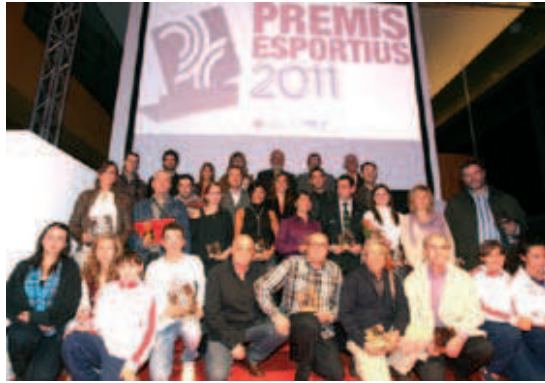
Foto de família dels guanyadors i premiats a la festa de l'esport local de la temporada anterior

Nominats. En l'apartat de millor entitat, només hi ha hagut tres candidatures que passen automàticament a ser finalistes: la UE Sant Joan de futbol, el Futbol Sala Montcada i l'Handbol La Salle. Pel que fa al millor entrenador –un premi nou–, també hi ha hagut només tres propostes que han accedit directament a ser finalistes. Es tracta