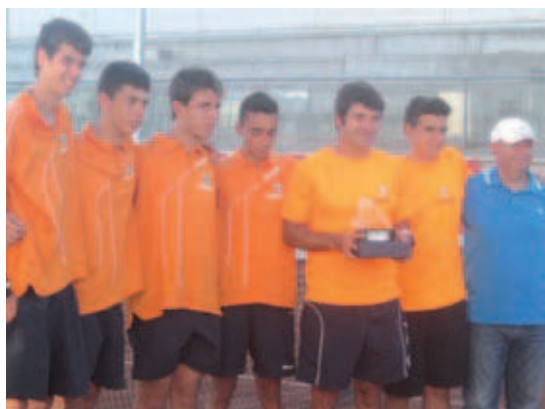
L'equip júnior del Tennis Reixac amb el trofeu de sotscampions de Catalunya