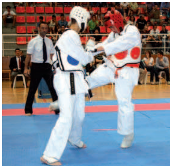
Un dels combats que va tenir lloc al Campionat de Catalunya disputat al pavelló Miquel Poblet