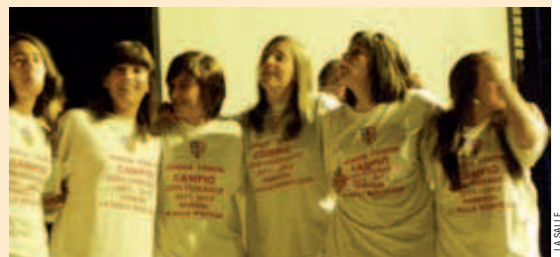
Les jugadores de La Salle van rebre el reconeixement del seu club en el sopar fi de temporada