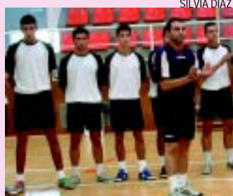
>> Equip juvenil del Vitelcom

Aquest diumenge comença la lliga per a l'equip juvenil A del Vitelcom Montcada amb un primer partit que es preveu molt emocionant, contra el Canet, un dels rivals més difícils de la lliga. Els joves montcadencs han realitzat una pretemporada intensa, entrenant quatre dies a la setmana, a per poder assolir èxits en aquesta categoria.