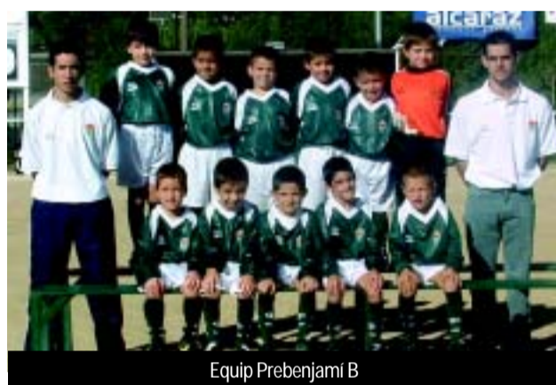
Equip Prebenjamí B