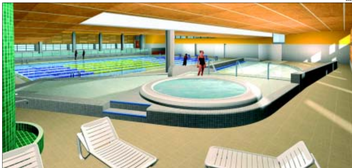
>> Imatge virtual de l'interior del recinte, amb el jacuzzi en primer terme, i les piscines

Abonaments afegits. El preu mensual de l'abonament per als adults és de 20 euros i de 13 per als infants i la gent gran. També hi ha disponible una tarifa familiar, que oscil·la entre els 37 i els 49 euros. Aquests abonaments permeten gaudir de la piscina, la sauna, el jacuzzi, el solàrium, el bany de vapor i les classes d'Aquagym. D'altra banda, l'abonament per participar en activitats físiques amb monitor i utilitzar la sala de fitness és de 6,50 euros al mes per als socis.