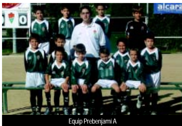
Equip Prebenjamí A