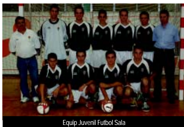
Equip Juvenil Futbol Sala