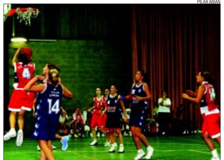
>> El Valentine femení va guanyar el Malgrat en una bona segona meitat