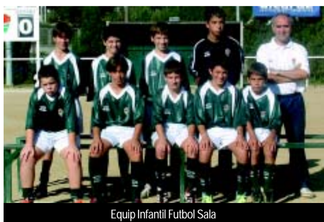
Equip Infantil Futbol Sala