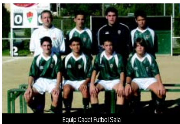
Equip Cadet Futbol Sala