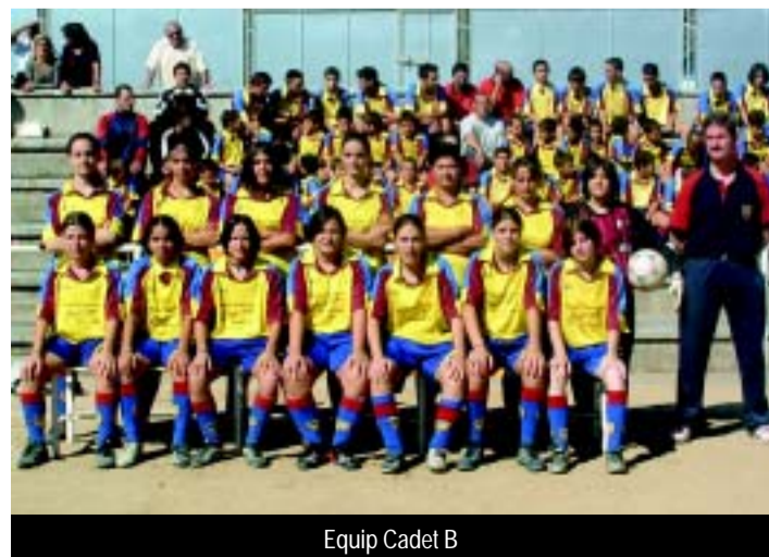
Equip Cadet B