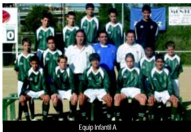
Equip Infantil A