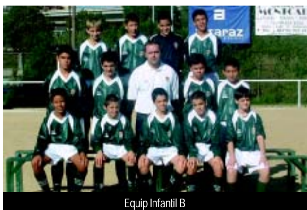
Equip Infantil B