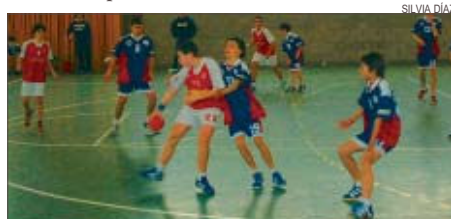
>> L'infantil A, davant el Corazonistas, el 12 de febrer