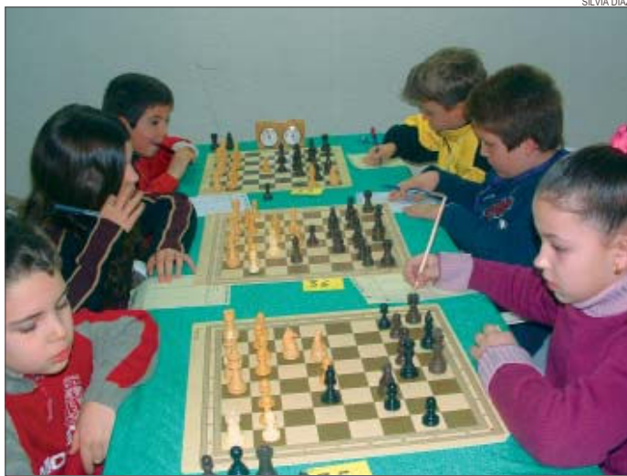
&gt;&gt; Les primeres rondes s'han disputat a les instal·lacions de la Penya d'Escacs Cerdanyola