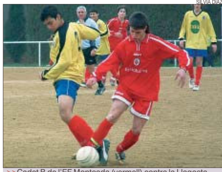
>> Cadet B de l'EF Montcada (vermell) contra la Lagosa