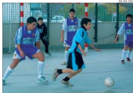
&gt;&gt; Partit del cadet contra el Montserrat de Barcelona