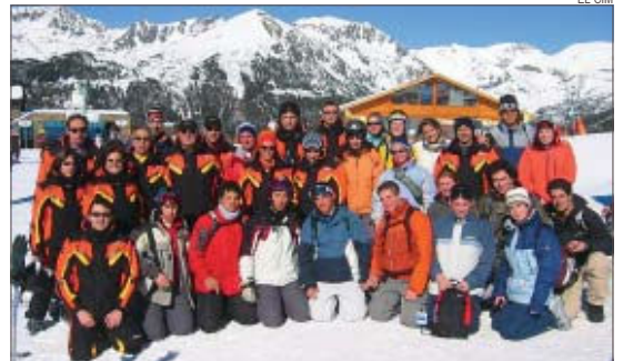
&gt;&gt; Els esquiadors que van participar a la sortida a Grand Valira