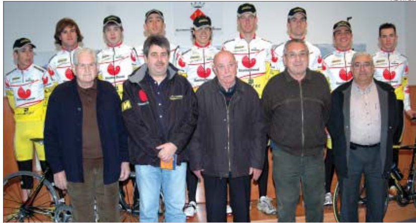
&gt;&gt; Els corredors catalans del CC Montcada amb els directius del club

Objectius. Les expectatives del Montcada passen per mantenir-se a Segona Divisió, tot i que enguany els seus objectius són més limitats perquè un dels espònsors ha retirat el seu suport i, per tant, el pressupost ha disminuït respecte l'any passat. Per manca de recursos, el club no s'ha plantejat l'ascens a Primera i, entre les renúncies més destacades, l'entitat ha decidit no