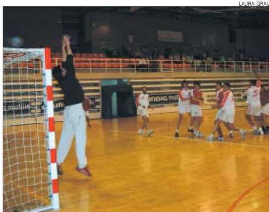
>> La Salle masculí lluita per passar al sector estatal i pujar a Primera