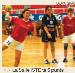
>> La Salle ISTE té 5 punts

La Salle ISTE segueix sense sortir del pou, amb dues noves derrotes a les últimes jornades. El 5 de febrer va caure derrotada a la pista del Molins de Rei, el segon, per un contundent 32-8. D'altra banda, l'equip de Josep Quirós va perdre contra el Castelldefels per 28-26, en una primera part espectacular de les jugadores montcadencs. A la represa, el matx va canviar de dinàmica, fruit sobretot del cansament físic de la plantilla. “És normal, perquè durant la setmana s'entrena poc” , ha indicat el tècnic, molt enfadat per la derrota davant un rival directe en la part baixa de la classificació de Primera Catalana. L'entrenador no s'ha mostrat preocupat per la permanència a la categoria —només baixa un equip— tot i que ha remarcat que no li agrada perdre. La Salle ISTE és antepenúltima amb 5 punts. SA