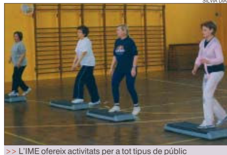
&gt;&gt; L'IME ofereix activitats per a tot tipus de públic