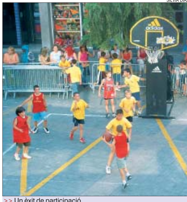
>> Un èxit de participació

La Diada 3x3 de bàsquet al carrer que es va celebrar el 12 de juliol a la plaça de l'Església va ser un èxit de convocatòria, amb 21 equips de categories mini fins a cadet que van jugar davant dues cistelles mòbils. Hi va haver força ambient tota la tarda.