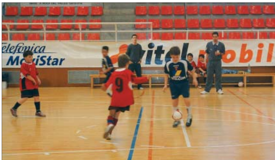
>> El CFS Montcada ha renovat els càrrecs tècnics i comptarà amb dos nous coordinadors de la base