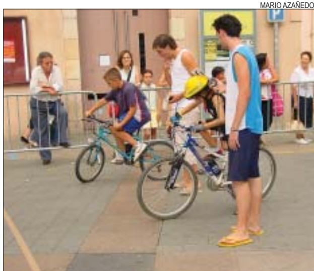
>> A la cursa guanya qui arriba l'últim

Un total de 110 persones, la majoria infants, va participar el 15 de juliol al VI Campionat Vila de Montcada de natació, de les categories benjamí, aleví, infantil i adults. El trofeu, que es va celebrar a la piscina municipal Zona Centre, va comptar també amb vuit equips de relleus. Les autoritats municipals van repartir els gairebé 50 premis.