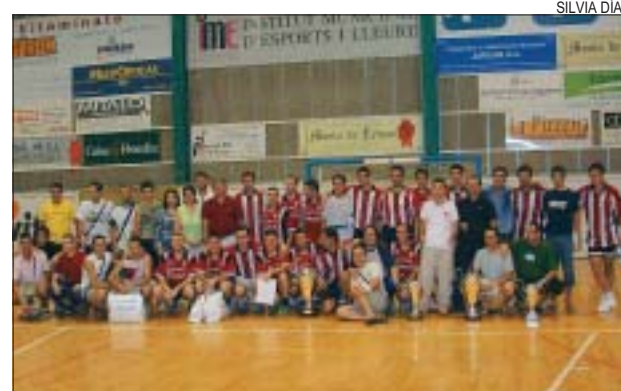
>> Els guanyador i els finalistes amb les autoritats

Un total de 40 persones va participar el 10 de juliol a una nova edició del Mulla't per l'esclerosi múltiple , que es va fer a la piscina municipal del carrer Bonavista. La jornada la va organitzar la Fundació amb el mateix nom, que a Montcada compta amb el suport de l'IME. En total, es van nedar 19.100 metres i es van recollir 625 euros entre la venda de material i els donatius. Els organitzadors han fet una valoració positiva, tot i que el temps no va acompanyar.