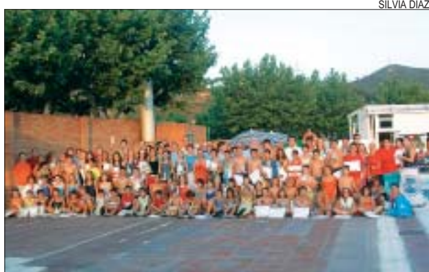
>> El trofeu va aplegar un centenar de persones

La diada de 3 x 3 de futbol al carrer va comptar amb la participació d'una vintena de conjunts que van demostrar les seves habilitats en les pistes que es van instal·lar davant del pavelló Miquel Poblet el 7 de juliol. El torneig va aplegar nombrosos públics. SA