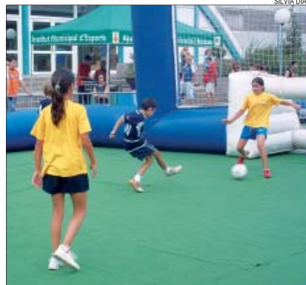
>> La diada de futbol va acollir nombrosos participants

la de l'any passat, tot i que el curs de danses africanes es va haver de suspendre per falta d'inscripcions. El que sí ha tornat a funcionar mot bé ha estat el casal d'estiu, amb 225 infants i joves inscrits. Parra ha avançat que "per a l'any vinent intentarem ampliar les places per a joves de 12 a 16 anys, ja que aquesta és la franja d'edat que més aviat s'omple perquè la resta de casals que es fan a Montcada són per a infants fins a 12 anys" .