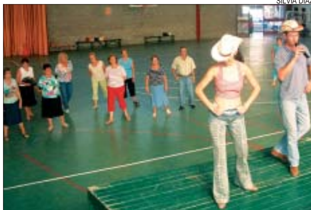
>> El country es va fer a la pista coberta

Un any més, els cursets de country han estat un dels més sol·licitats del Montcada és estiu . S'hi han inscrit 45 persones, que cada dilluns i dimecres entre l'11 i el 20 de juliol s'han acostat al ball de la música folk del sud d'Amèrica del Nord. Les classes s'han fet a la pista coberta.