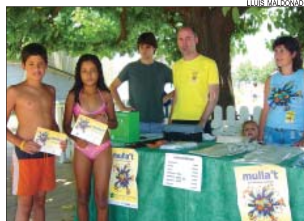
>> Els participants al Mulla't van rebre un diploma