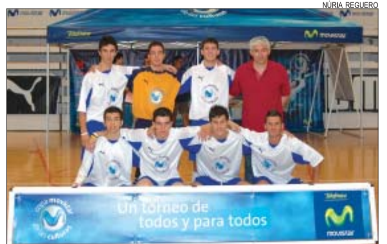
&gt;&gt; L'equip Montcada Cultura ha passat a la ronda següent