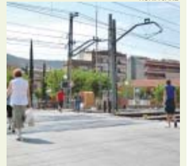
>> Pas a nivell del carrer Bogatell

Segons les previsions del Ministeri de Foment, durant el primer semestre del 2006 s'iniciaran les obres de soterrament del Tren d'Alta Velocitat (TAV) i de la línia de França al seu pas per Montcada ja que l'objectiu és que a mitjan del 2009 la connexió entre Barcelona i França estigui acabada i en funcionament. Mentrestant continuen a Madrid les trobades entre representants ministerials i de l'Ajuntament per acabar de consensuar totes les qüestions tècniques del projecte que es vol donar a conèixer públicament al setembre.