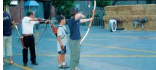
&gt;&gt; La diada de tir amb arc va acollir força públic