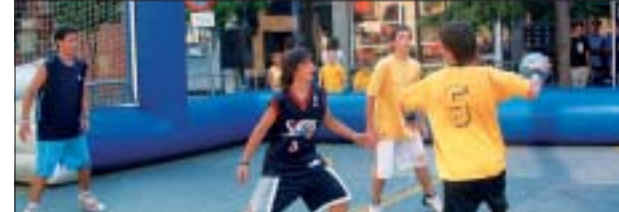
&gt;&gt; Els partits van ser molt emocionants