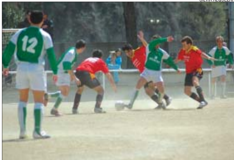
&gt;&gt; El CD Montcada començarà a entrenar el 16 d'agost

Els rivals. El CD Montcada ha quedat enquadrat novament en el Grup Primer de Preferent. L'equip local es tornarà a veure les cares amb clubs com el Vic i l'Escala que, juntament amb el Montcada, són favorits en la lluita per l'ascens. Entre les novetats més destacades d'enguany,