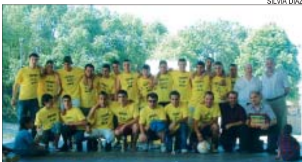
>> Alguns dels juvenils han deixat aquest any l'escola