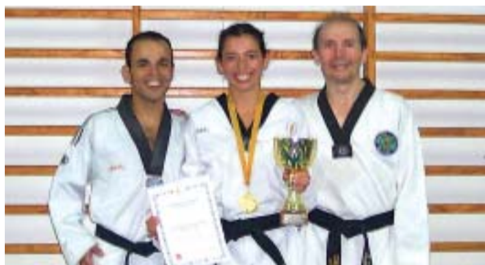
>> La selecció espanyola que va competir a Finlàndia, amb nombrosos components del Lee Young