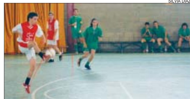
>> L'equip juvenil en el partit contra el Mollet

Els conjunts cadet i juvenil van guanyar el seu respectiu triangular en el torneig "Vila de Montcada" de futbol sala que es va celebrar el 18 de juny. El cadet va obtenir la primera posició davant del Parets i el Miró Martorell. El juvenil va quedar primer per davant de l'Olesa i el Mollet. L'equip infantil del CD Montcada va ser segon del seu grup, mentre que el Martorell va ser primer i el Mollet, tercer. SD