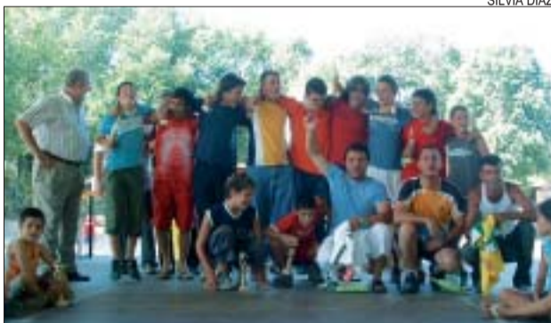
>> Els infantils han guanyat tots els partits de lliga