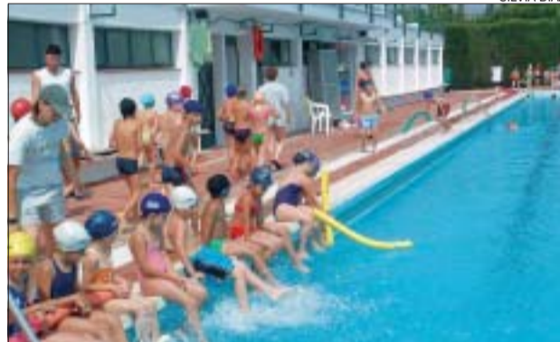
&gt;&gt; La natació és una de les activitats favorites dels infants