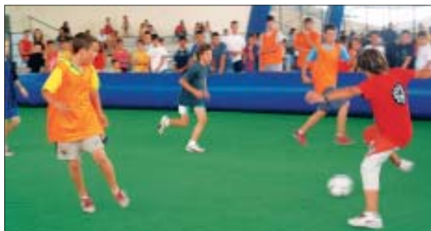
&gt;&gt; A dalt, 3x3 de bàsquet a Can Sant Joan. A baix, 3x3 de futbol