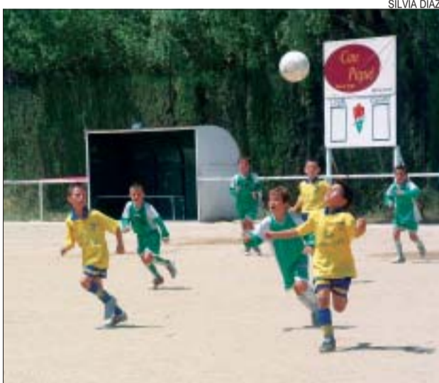
>> Els prebenjamins contra el Fontetes cerdanyolenc

Centenars de montcadencs van participar a la festa de cloenda de la temporada del CD Montcada, que va tenir lloc el 18 i 19 de juny al camp de la Font Freda. Tots els equips de la base del club van disputar un triangular en dues jornades que tenien un objectiu festiu i formatiu. Molts col·legis de Montcada i Reixac i escoles de futbol van participar a l'acte. Aquest ha estat el darrer trofeu Vila de Montcada que organitza el CD Montcada. El planter formarà part la propera temporada de la nova Escola de Futbol Montcada. SD