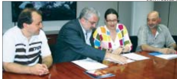
&gt;&gt; Alcalde i Prieto amb els presidents de l'IME i l'Àrea Social