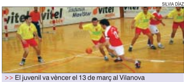
>> El juvenil va vèncer el 13 de març al Vilanova

El juvenil i el cadet masculí del CH La Salle Montcada estan repetint les mateixes bones marques que van aconseguir la temporada passada. El juvenil va acabar líder la primera fase del Campionat i a la segona ha començat amb el mateix bon peu. El primer partit, que els va enfrontar amb el Sant Vicenç -líder del grup B- els de Rubén Crespo van guanyar per un ajustat 27 a 28. Els dos següents partits també van acabar amb victòria per a La Salle, 23-27 davant Les Franqueses i 26-20 amb el Vilanova. El cadet és líder del seu grup i el 13 de març va guanyar el darrer partit de la primera fase contra el Sant Cugat (36-21). D'altra banda, la coordinadora del club, Esther González, és la nova entrenadora del cadet femení, en substitució de Jordi Martín. SD