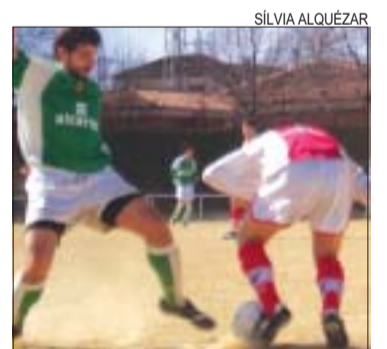
>> El Montcada lluita per l'ascens