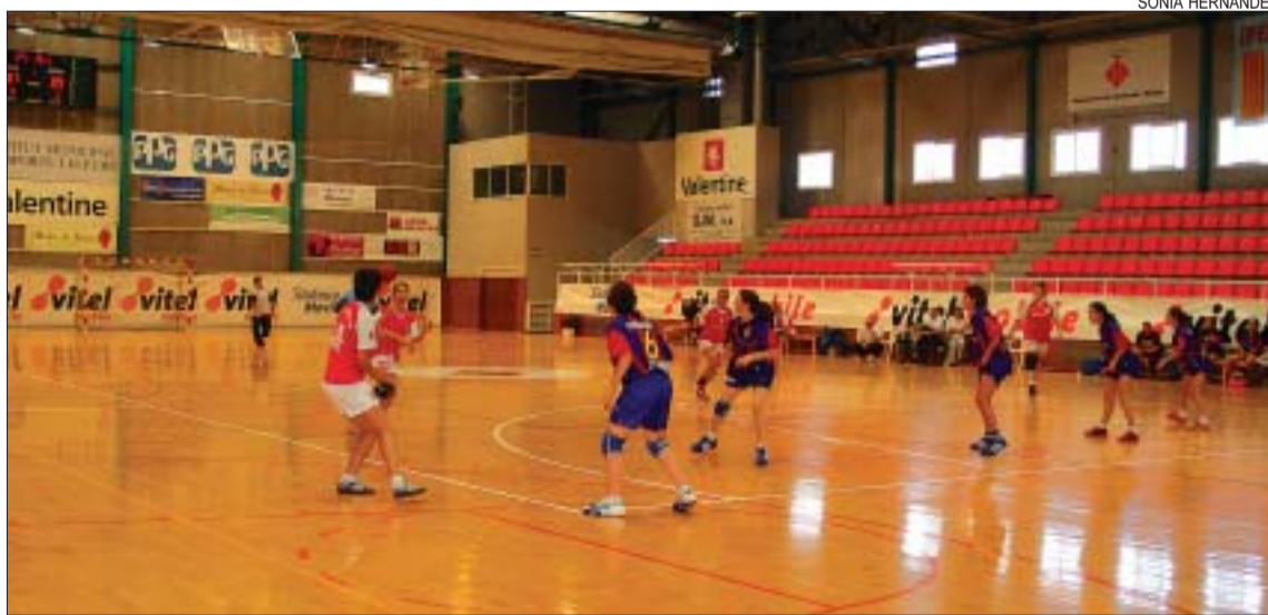
>> La Salle femení espera guanyar els quatre partits que resten per salvar la categoria