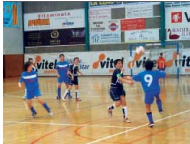
>> Jugada del partit de l'aleví B del Vitel contra el Centelles

El Centelles, líder del grup 2, no va poder amb l'aleví B -tercer- ni amb tota l'afició que s'hi va aplegar el 5 de març al pavelló Miquel Poblet per seguir un dels partits més emocionants de la lliga. El Vitel va començar dominant el partit i va arribar a tenir un avantatge de 2 a 0. La primera part va finalitzar amb un 2 a 1 al marcador i, a la represa, el Centelles va remuntar fins a assolir el 2 a 3. Pocs minuts abans d'acabar el partit, el Vitel va reaccionar i va aconseguir el 3 a 3 i a tres minuts del final, el 4 a 3 definitiu. Al partit d'anada, a la jornada 7, el Centelles va guanyar el Vitel per 6 a 0. SD