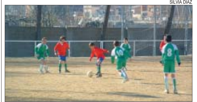
>> El Montornès Nord (vermell) és un dels rivals de l'aleví