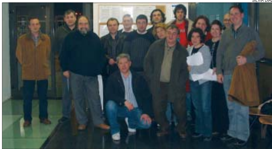
>> Els membres del CDEM, amb el regidor d'Esports

Projectes. Els objectius prioritaris de la nova junta són reforçar la identitat del CDEM, aconseguint que sigui el referent esportiu dels nens en edat escolar, i crear una lliga local de secundària.