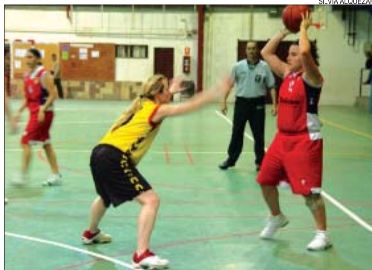
&gt;&gt; El Valentine femení lluita per la segona posició de Primera Catalana