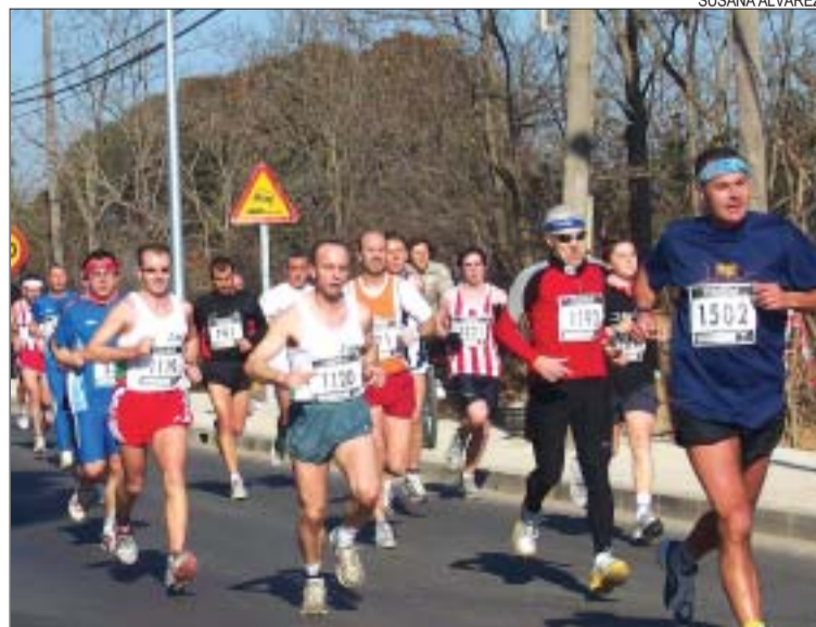
&gt;&gt; Els atletes de la JAM van fer un bon paper a Montornès