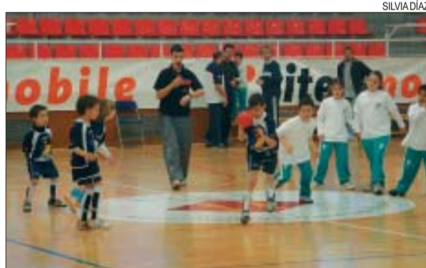
>> El Vitel va jugar contra el Font Freda el 5 de març