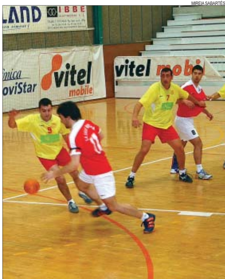
&gt;&gt; La Salle es troba a la cinquena posició de Primera Catalana