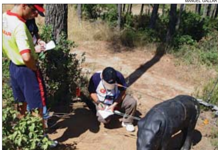
&gt;&gt; Can Piqué ha acollit ja en diverses ocasions tornejos de prestigi