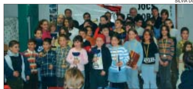
>> Els primers classificats d'escacs amb les autoritats

Catorze integrants de la secció de Gimnàstica Rítmica de la Unió participaran el 2 d'abril a la fase final comarcal de gimnàstica que se celebrarà al Pavelló municipal d'Esports de Cerdanyola. Les montcadenques participaran en les categories benjamí, aleví i infantil. En grups, l'equip que competirà el formaran les infantils. D'altra banda, en escacs, el pavelló Miquel Poblet va acollir el 12 de març el lliurament de premis de la