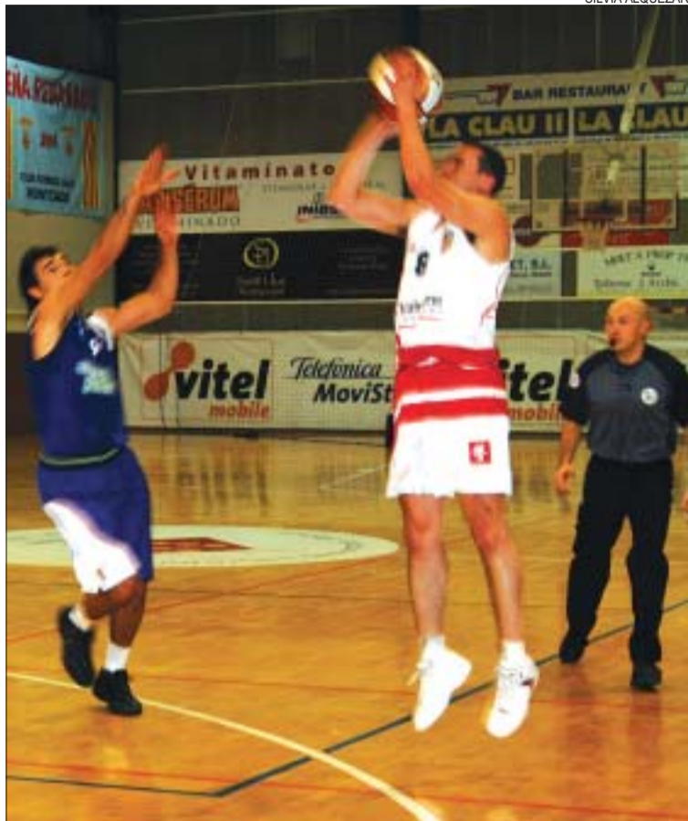
&gt;&gt; El Valentine no va estar fi en els llançaments davant del Prat

En acabar el matx, el tècnic local va reconèixer que el seu equip no va jugar bé als primers minuts. "Ens van fer un parcial de 4-21 al primer quart, vam estar espesos en atac i a partir d'aquí ja no ens va sortir res" , ha comentat Saura, qui ha reconegut que amb els 17 punts per sota en el descans, l'equip estava ja ensorrat. El capità del