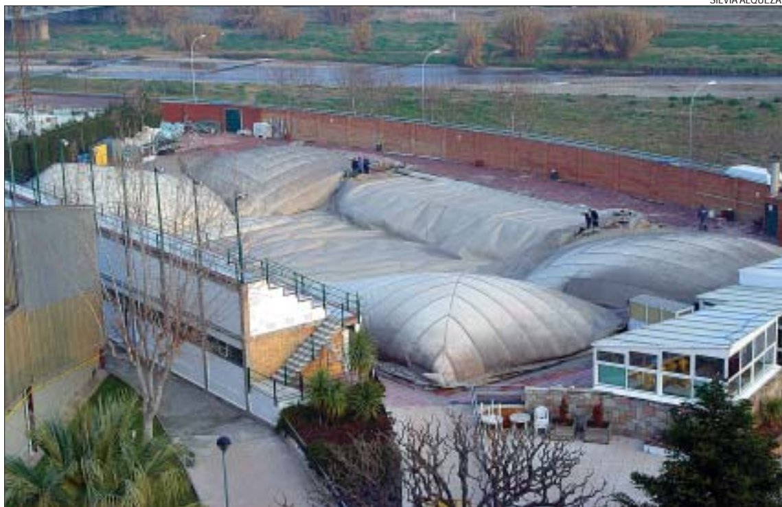
>> Serveis Municipals va treure el globus per última vegada el passat 19 de febrer

mensions olímpiques, hi van entrenar clubs importants com el Barça, el Granollers, el Sant Andreu i el Sabadell. La selecció espanyola de Barcelona 92 va preparar-se a Montcada perquè llavors el Centre d'Alt Rendiment de Sant Cugat no tenia piscina de 50 metres.