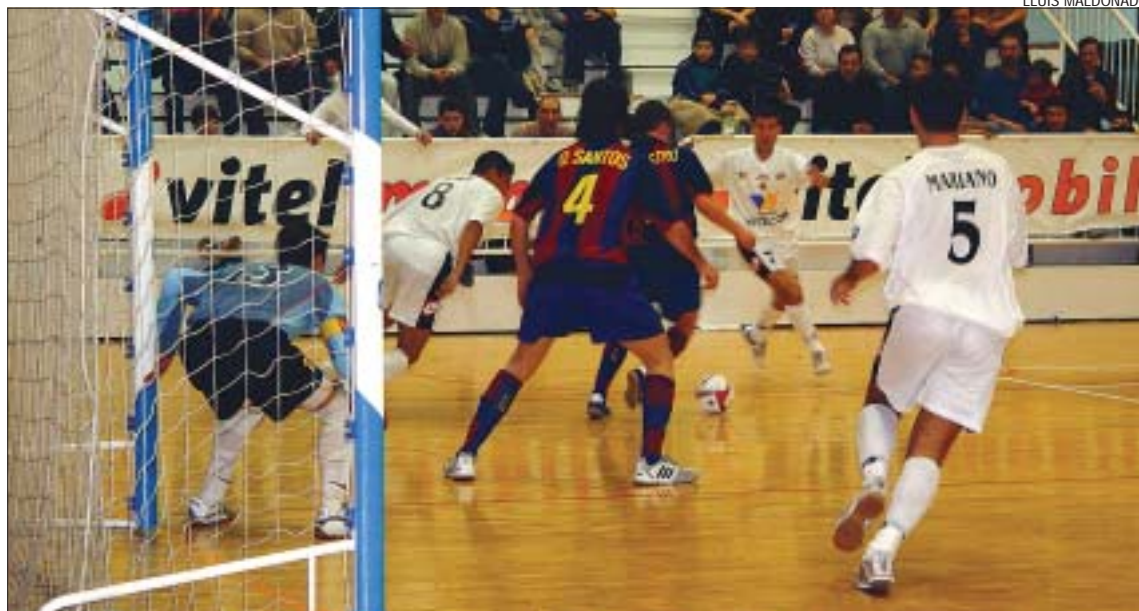
>> El Vitel va perdre contra el Barça a casa per un ajustat 2-3