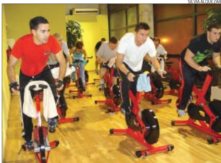
>> Les sessions d' spinning a Montcada Aqua tenen molt d'èxit

combinen passos i músiques procedents de balls i ritmes llatins–, step latino –sessions d'step al ritme de la música amb passos procedents de balls llatins–, aeròbic –sessions coreografiades al ritme de la música amb la finalitat de millorar la resistència aeròbica i la coordinació– i ciclo indoor –sessions d'entrenament cardiovascular en bicicleta estàtica, indicada per millorar el sistema cardiovascular i la resistència. Els abonats a les activitats dirigides no cal que s'inscriguin prèviament a cap sessió, excepte a l' spinning , ja que