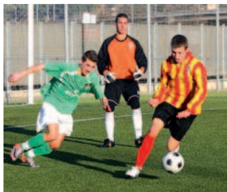
El CD Montcada es troba entre el grup d'equips que lluiten per l'ascens

Silvia Alquézar | Redacció Passen les jornades i cada vegada està més emocionant la recta final de la lliga al Grup Setè de Primera Divisió. El CD Montcada no falla i segueix entre el grup capdavanter que lluita per ascendir a Preferent, un objectiu que només aconseguirà el primer classificat. Els verds es troben a la segona posició