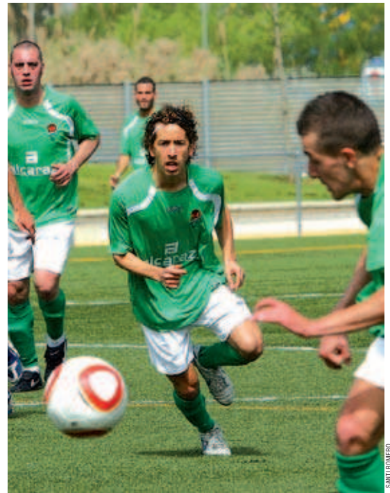
El CD Montcada vol superar l'Olot, el líder, el dia 17 a casa per apropiarse més a la salvació

L'entitat farà tot el que estigui a les seves mans per donar suport a la plantilla en els moments més delicats de la temporada. La directiva ha posat en marxa una campanya per omplir les graderies de l'estadi de la Ferreria en els quatre partits que quequen a casa: Olot, Poble Sec, Guixols i Olímpic Can Fatjó. Les persones que hi vulguin assistir poden aconseguir invitacions de dilluns a divendres de 19 a 22h a les oficines del club, a l'estadi de la Ferreria. El CD Montcada és a l'antepenúltim lloc amb 34 punts.