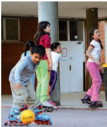
El patinatge és una de les activitats extraescolars que s'oferta a El Turó

Ajuts. En total, mouen el cos d'una manera o una altra gairebé 120 alumnes cada setmana, que només han de pagar 8 euros per cada activitat que fan gràcies a la subvenció del Pla Català. "Optem perquè faci esport el màxim nombre d'infants possible a un preu bastant assequible" , diu Gálvez.