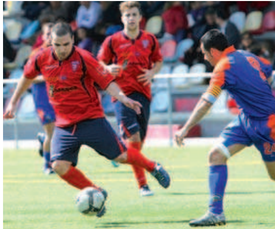
El Sant Joan viu aquests dies els millors moments de la temporada en joc i resultats