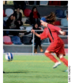
L'equip femení jugarà un torneig a l'Alguer