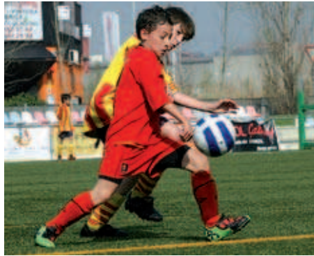
L'aleví A es troba a la quarta posició amb opcions de quedar més amunt

Silvia Alquézar | Redacció A falta de cinc jornades perquè acabi la lliga, l'equip juvenil està cada vegada més a prop d'aconseguir l'objectiu de la temporada: pujar a Primera Divisió. Els nois de Manolo Jiménez són més líders, ja que sumen 52 punts al Grup 25 de Segona Divisió i estan a 6 punts del seu perseguidor més immediat, la Penya Barcelonista de Sant Celoni. Els montcadencs segueixen fermes en la lluita per l'ascens amb nous triomfs. Els locals van vèncer el Llerona per 1-6, el Cardedeu per 1-2 en el maxt ajornat del 12 de març i el Martorelles per 7-1. A les dues pròximes jornades, el Montcada jugarà a l'estadi contra la Llagosta i el Lourdes de Mollet.