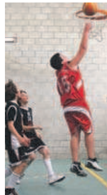
El sots-21 masculí va vèncer el Gavà

Silvia Alquézar | Redacció L'equip mini B del Valentine ha millorat el joc i els resultats en la segona fase de la temporada. Els nois que entrena Marc Amenós estan jugant la fase regular Nivell C-1. Al Grup Setè, el Montcada es troba a la quarta posició amb 6 victòries i 4 derrotes. A les dues últimes jornades disputades, el mini B va guanyar de forma clara l'AESE B, el cinquè amb 4 triomfs, per 83 a 35. Al matx anterior, els montcadencs no van poder superar el segon classificat sense conèixer encara la derrota, el CAT Mini, amb qui van perdre per 88 a 50. A la primera