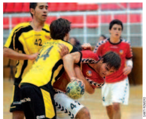
El juvenil de La Salle va acabar la Lliga Catalana a la vuitena posició

Silvia Alquézar | Redacció L'equip juvenil de La Salle ha iniciat la Copa Catalunya amb una derrota. El conjunt de Jaume Puig va perdre contra el Granollers, el campió de la Lliga Catalana, per 42 a 28. Malgrat la diferència, els montcadencs van començar el partit bé, amb un avantatge de fins a dos gols en el marcador fins