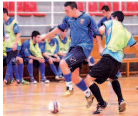
El juvenil del Mause es troba a la vuitena posició de la màxima categoria

Silvia Alquézar | Redacció L'equip juvenil de l'FS Mause està situat a la zona tranquil·la de la classificació a la Lliga Nacional, la categoria més important. Els montcadencs es troben a la vuitena posició amb 30 punts, a un de diferència del Manresa i a tres d'avantatge respecte La Unió, el seu immediat perseguidor. Després