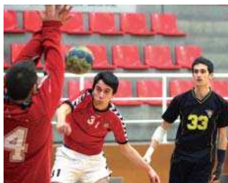
La Salle B va aconseguir una victòria important contra el Pau Casals (31-30)

El sènior masculí de l'Elvira-La Salle es troba a la quarta posició del Grup Cinquè del Campionat de Catalunya sènior, amb 16 victòries i 5 derrotes. A l'última jornada, els locals van superar el Regina Carmelí, al mig de la taula, per 65 a 73. L'equip ja està preparant el derbi montcadenc contra el CEB Can Sant Joan on sortirà de local a la pista del Gimnàs de la Zona Centre, el 27 de març a les 18h | SA