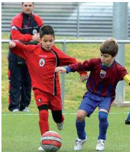
El prebenjamí C va superar el Segarra per 6 a 5 a l'estadi de la Ferreria

Futbol sala. L'equip juvenil de la secció de futbol sala de l'EF Montcada es troba a la segona posició al Grup Primer de Primera Divisió amb 38 punts. Els montcadencs estan fent una gran temporada, amb només dues derrotes fora de casa des que va començar la competició. A l'última jornada, els locals van superar el Sagarra, el quart classificat, per 6-5.