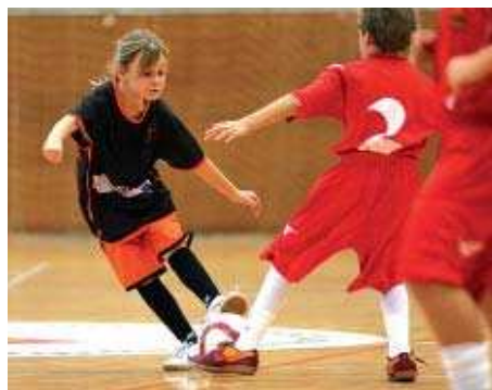
L'Elvira-La Salle ha creat aquesta temporada la secció de futbol sala