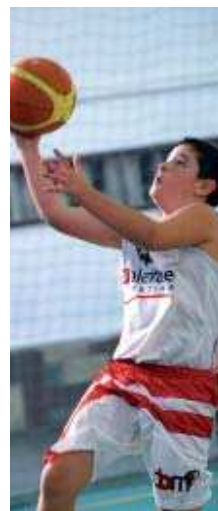
El premini és a la sisena posició

ra que passen una estona entretinguda. La plantilla, amb moltes ganes, està fent una bona campanya. En la pròxima jornada de lliga, el 10 d'abril, el premini es desplaçarà a la pista del Maristes Ademar A, el darrer classificat del grup amb cap victòria en els 9 partits disputats fins a l'actualitat.