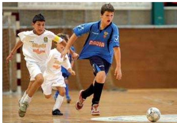
El conjunt benjamí del FS Mausa Montcada aspiren a jugar el Campionat d'Espanya de la categoria

Silvia Alquézar | Redacció L'equip benjamí de l'FS Mausa Montcada segueix ferm al capdavant de la classificació de la Divisió d'Honor, la màxima categoria. Els montcadencs es troben a la segona posició amb 46 punts i un partit menys. Els locals van superar el Masnou per 12-0 al darrer matx de lliga disputat. El conjunt que dirigeix José Andrés llui-