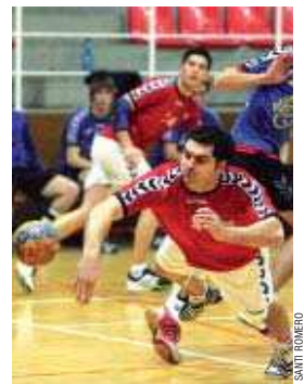
La Salle seguirà sent equip de la Lliga Catalana

La Salle masculí ha aconseguit el principal objectiu de la temporada: mantenir-se a la Lliga Catalana. Una ratxa de quatre victòries consecutives ha permès als locals assegurar-se una plaça a la màxima categoria catalana de cara a la temporada vinent. Els homes de Dídac de la Torre van confirmar la permanència davant del Vilamajor, a qui va superar per 29 a 25 el dia 13. Per a l'entrenador, "el canvi d'actitud, augmentar els dies d'entrenaments i la recuperació dels jugadors lesionats" són els motius principals de la reacció de la plantilla en la recta final de la competició. La ratxa positiva de resultats ha quedat trencada a l'última jornada, on els locals van perdre a la pista del Sant Quirze, el tercer classificat, per 35 a 29.