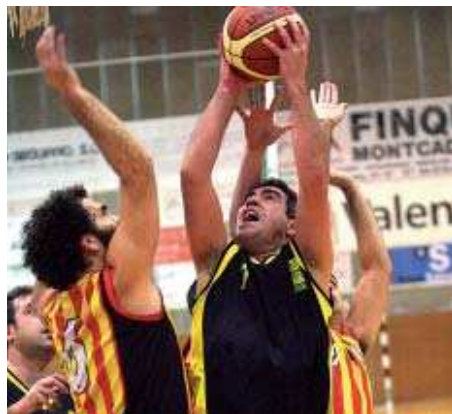
El B. Montseny-CEB Can Sant Joan s'ha retrobat amb la victòria

L'equip sènior de futbol sala de l'EF Montcada va obtenir una treballada victòria contra el conjunt de Quatre Camins per 7 a 2. Els locals van perdre una setmana després contra l'Aiguafreda, el líder, per 4-2. El bloc és antepenúltim amb 14 punts al Grup Segon de Segona Divisió. Per la seva banda, el Mausà B va guanyar el DAE per 8-0 | SA