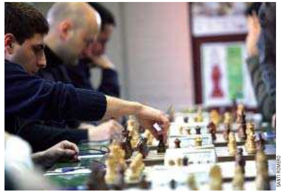
Un moment de les partides de la vuitena ronda entre la UE Montcada i l'Uga, al pavelló M. Poble