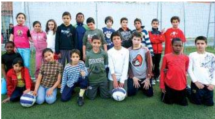
Els infants del Casal de la Ribera que formen part del projecte esportiu de l'IME

Un èxit. "Els nois i noies estan molt contents perquè coneixen les entitats i els diferents esports que hi ha al municipi", ha dit la coordinadora del Casal,