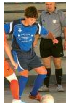
El cadet va perdre contra el Ràpid

Altres resultats. Pel que fa a la resta d'equips del planter de La Salle, el conjunt cadet va caure derrotat a la difícil pista del Granollers per un clar 40 a 23. Per contra, l'equip infantil segueix en la seva línia imparables en imposant-se al Safa Horta per un contundent 22 a 8. L'infantil femení tenia jornada de descans.